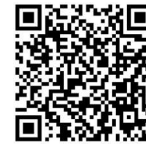
QR-Code zum Mebisraum der Tabletscouts

beseitigt und wichtige Verhaltensregeln wiederholt. Seit diesem Schuljahr haben unsere Tabletscouts auch einen eigenen Mebisraum, in welchem sie bei technischen Problemen erste Hilfe leisten und auch neue Tipps und Tricks verraten.